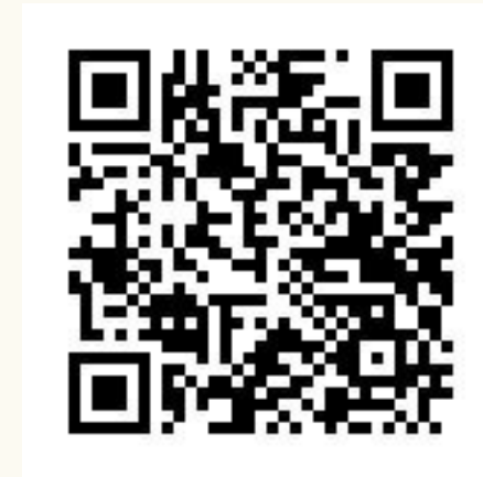
載具歸戶說明專區