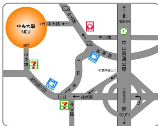
中央大學 交通路線圖

中央大學土木系工程一館 E-134、E-135、E-247 或 E-250 教室（320317 桃園市中壢區中大路 300 號）