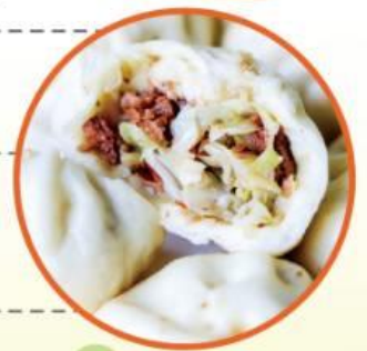
-----蔬食烹飪班 報名表-----