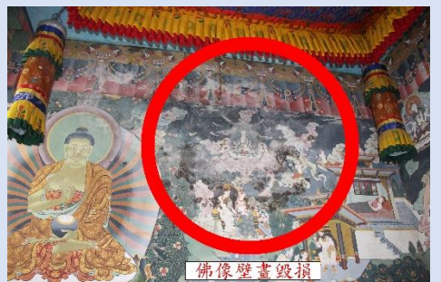
屋頂及佛像壁畫多處毀損現況