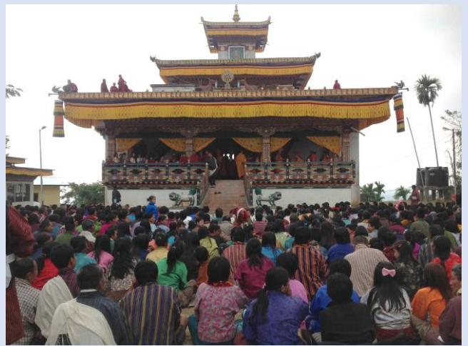
貝瑪令寺一年一度安太歲除障法會剪影