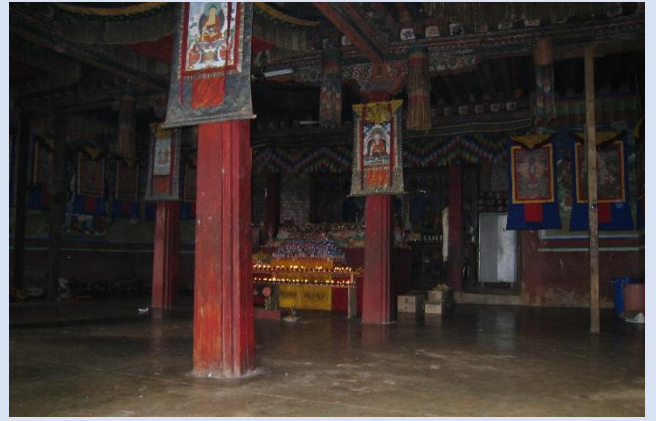
貝瑪令寺(未重建舊大殿相片)