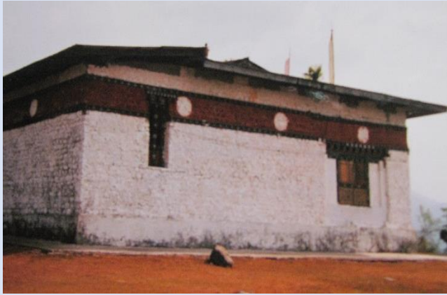
貝瑪令寺(未重建舊相片)