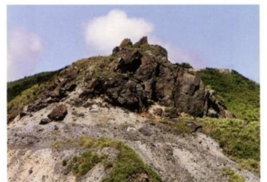
圖6 九份最初發現金脈之小金瓜露頭

日期：112 年 03 月 19 日 (星期日) 07:15 捷運中正紀念堂站 5 號出口集合，07:30 出發。