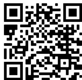
南部班報名 QR code

※醫事人員教育積分(職能治療師、物理治療師、臨床心理師、諮商心理師)申請中，認證時數依審核結果為準。