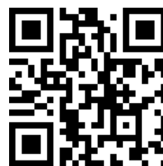
報名 QR code