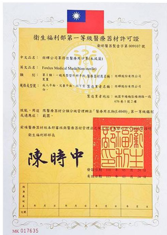
衛部醫器製壹字第009107號