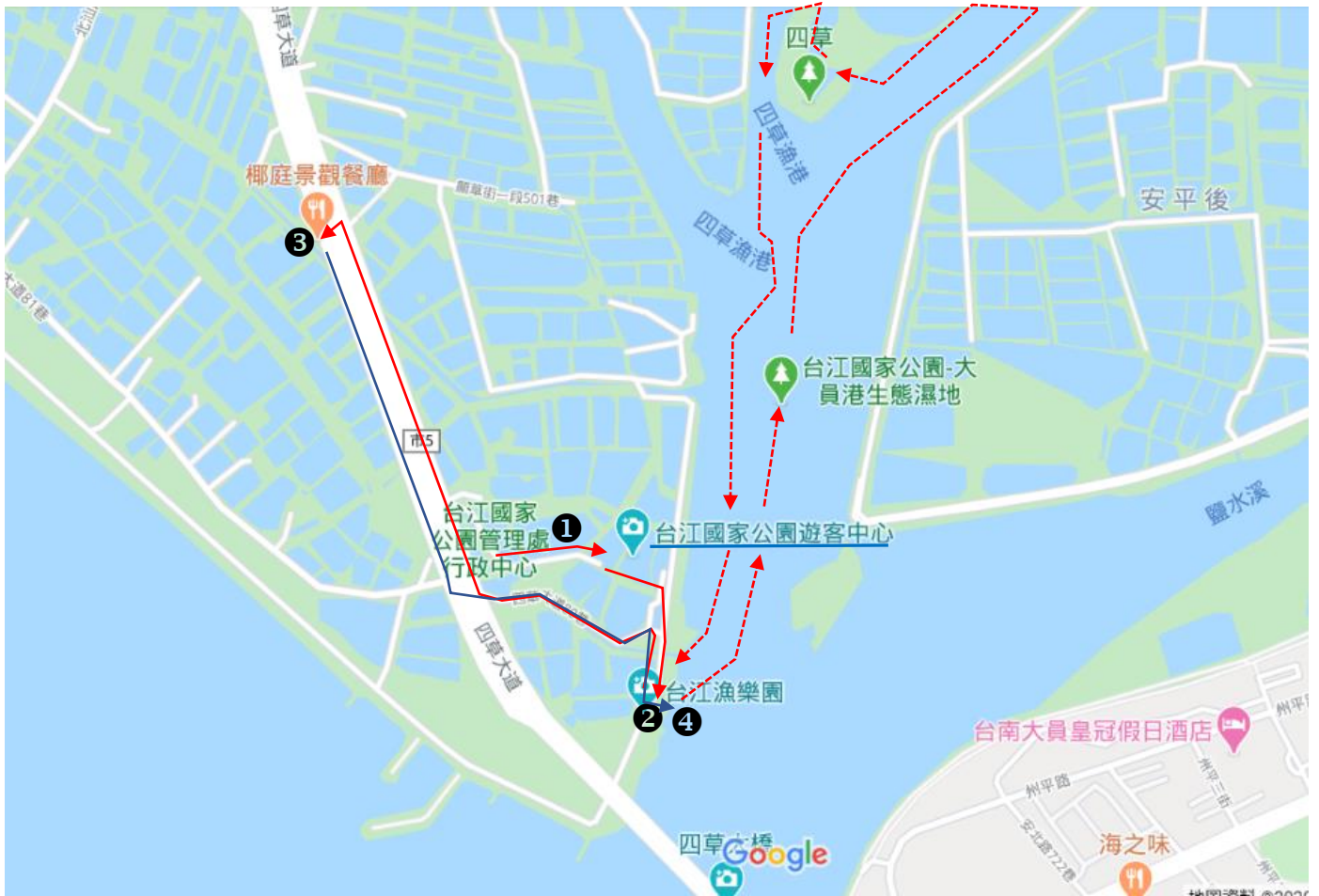
■地圖：各行程景點位置及路線圖(如附圖)。