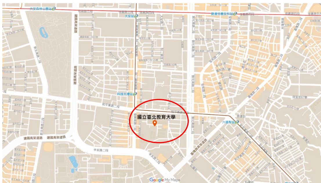
臺北教育大學 交通路線圖