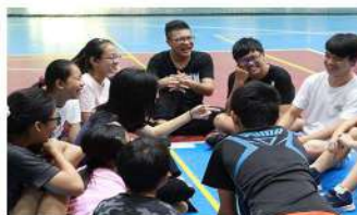
▲音樂肢體韻律課程

透過國內專業師資與跨領域課程增進學員音樂技能與團隊策展行政能力，活潑有趣的活動激發學員對藝術領域的火花與熱情。