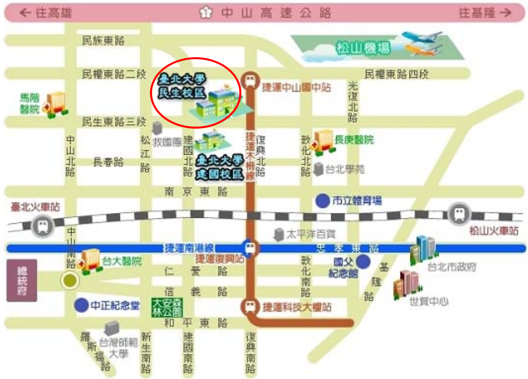
台北大學民生校區交通路線圖