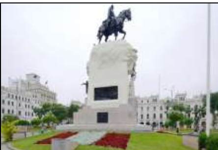
聖馬丁廣場 Plaza San Martin