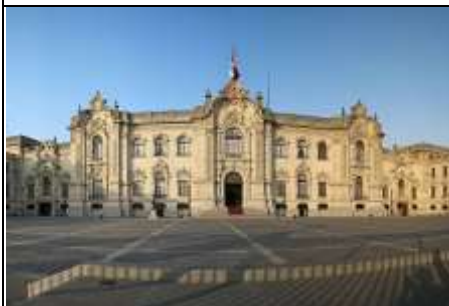
總統府 The Government Palace

參觀利馬主要的廣場，在這邊我們將看到總統府 The Government Palace (不入內參觀)，聖馬丁廣場 Plaza San Martin，大教堂 the cathedral (不入內參觀)等充滿殖民地風格的建築。