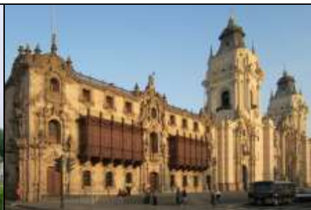
大教堂 the cathedral