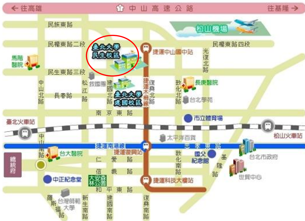
台北大學 民生校區 交通路線圖