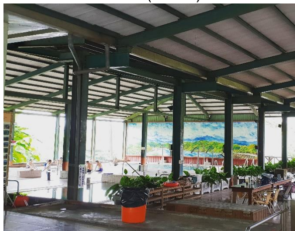
溫泉及山泉大眾池