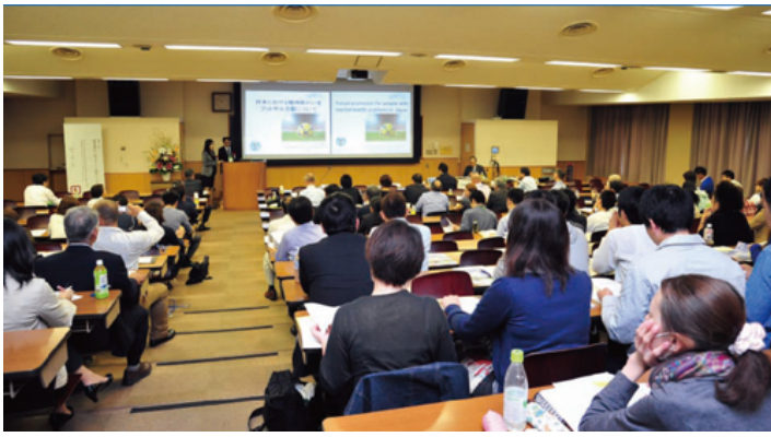
2013年8國聯合於東京發表宣言 及參與研討會