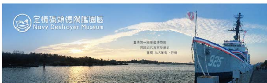
安平定情碼頭/港濱歷史公園

安平定情碼頭/港濱歷史公園： (德陽艦/林默娘公園/港濱歷史公園)港灣沿線曾經是一片荒煙漫草，人煙絕跡，豪無榮景可言，經市府團隊精心擘畫及大力整頓建設，終於麻雀變鳳凰，名為「安平夜明珠」，然今非昔比，先有「林默娘」雕像矗立港邊成為安平港新地標，後經「2005 鳳鳴玉山」、「2006 槃瓠再開天」台灣燈會相繼突破 670 多萬參觀人潮的洗禮，留下千萬人足跡，近年再添增德陽艦新地標將此景推上舉世無與倫比，好比槃瓠再開「府城」新天地，告訴你！夜遊安平港粉浪漫喔！欲窺其貌不如身入其境漫遊一番。