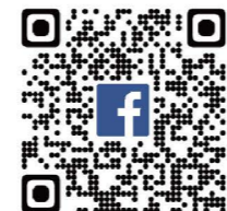
臺北市職探體驗中心