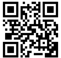
報名網站 QR code