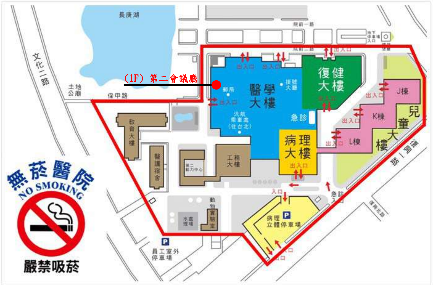
林口長庚醫院院區配置圖