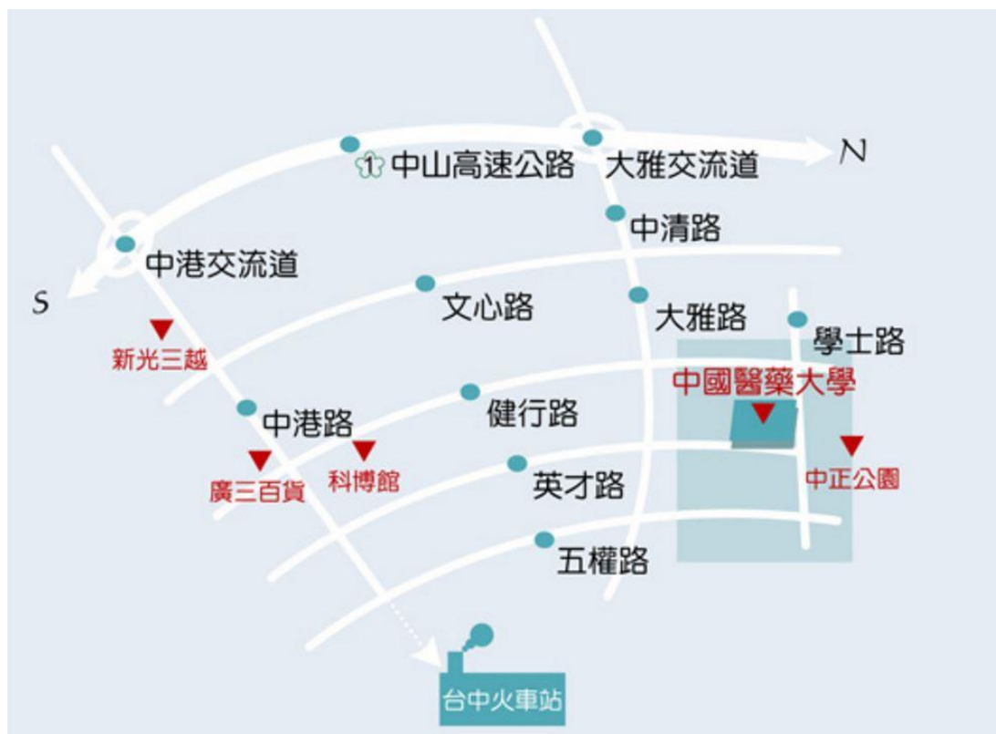
台中校本部交通地圖