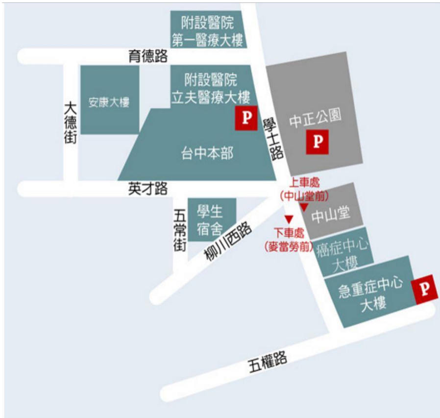
高鐵免費快捷專車－中國醫藥大學站 接駁位置圖

97年1月16日起高鐵台中站免費接駁專車延伸至本校發車(統聯客運)，分別於【台中站6號出口13號月台】及【學士路「中國醫藥大學」市公車站牌(中山堂前)]上車，車程約40分鐘。搭車位置可參考下圖：