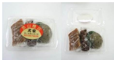
赤山標 3 個