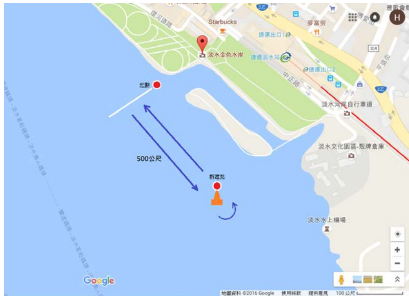
圖 3. 競賽組 1 公里組航行路線