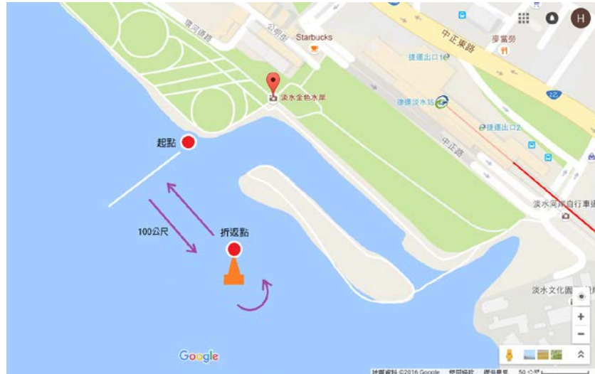
圖 2. 競賽組 200 公尺航行路線